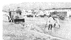
Una de las zonas afectadas por las lluvias.

Por su parte el cuerpo de Ecología de Seguridad Pública, Tránsito y Protección Civil, mantendrá el operativo vigilando ante cualquier contingencia que se pudiera presentar en la ciudad.