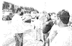
El alcalde Everardo Benavides Villarreal en un momento de su supervisión de daños.

El Alcalde de Juárez, Everardo Benavides Villarreal, realizó un recorrido por algunos de los puntos donde se presentaron daños tras las recientes lluvias suscitadas en toda el área metropolitana.