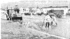
Una de las zonas afectadas por las lluvias.

Por su parte el cuerpo de Ecología de Seguridad Pública, Tránsito y Protección Civil, mantendrá el operativo vigilando ante cualquier contingencia que se pudiera presentar en la ciudad.